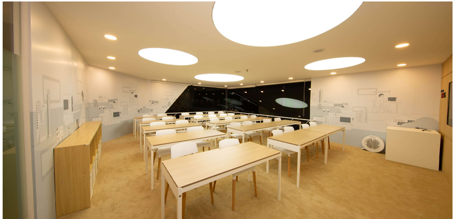
▷ 2층은 주니어 공학 교실로 어린이들을 대상으로 기초 과학기 술을 가르쳐주는 공간 The second floor is a junior engineering class- room teaching fundamental science and technol- ogies to children.