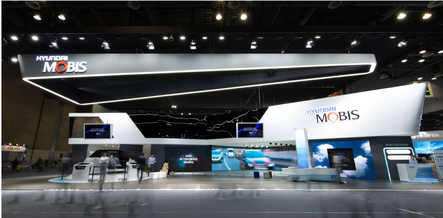
▽ 수소연료전지를 활용한 발전시스템 전시 공간 Exhibit space for power generation system using hydrogen fuel cell.