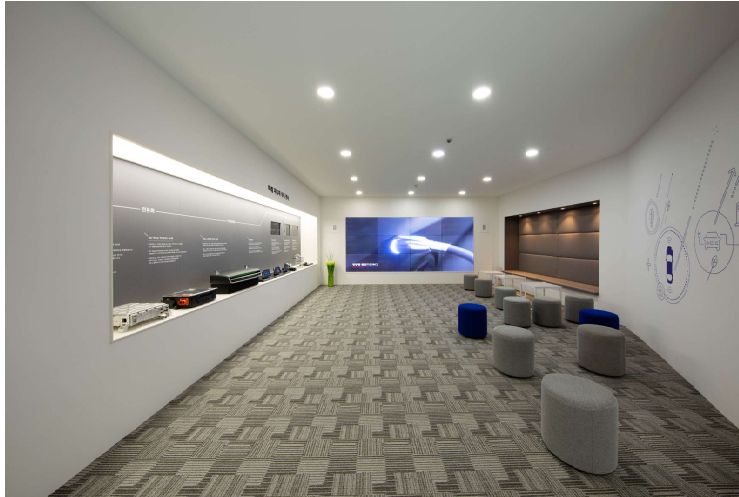
▷ 미래 자동차 부품 전시 공간 Exhibit space for future auto-motive components.